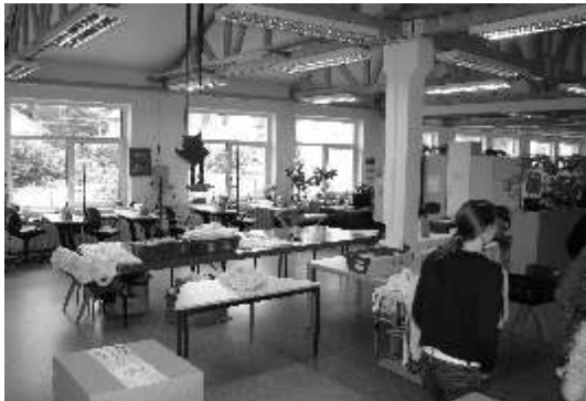
Blick in die Pskower Werkstätten

Die Initiative Pskow stellt sich in Wolgograd vor