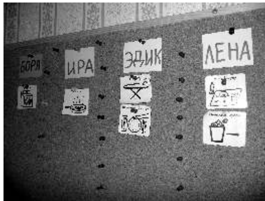
Infobrett in der Trainingswohnung

Bis zum heutigen Tag löst die Russische Föderation das Wohnen von Menschen mit einer geistigen Behinderung auf sehr einfache, aber für die Betroffenen selbst sehr entwürdigende Art: Wer bei seinen Eltern nicht wohnen kann, kommt in ein so genanntes Psycho-Neurologisches Internat. Betroffen davon sind ca. 80 % aller Menschen mit einer geistigen Behinderung, entweder weil ihre Eltern sie nicht wollen oder weil sie keine Eltern mehr haben. Die Internate aber sind Wegsteckheime. Alle, die in der Gesellschaft nichts leisten, werden hier zusammengeschlossen: Behinderte, Alte, entlassene Strafgefangene, Menschen von der Landstraße.